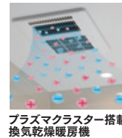
プラズマクラスター搭載 換気乾燥暖房機