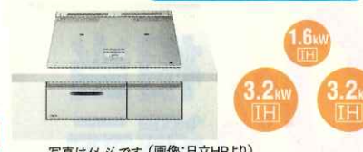
写真はイメージです

※取付工事費を含みます。 工事内容によっては、別途費用が発生する場合がございます。 ※ガス調理器の取外工事費が別途必要となります。