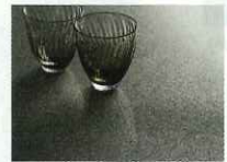
セラミックトップ