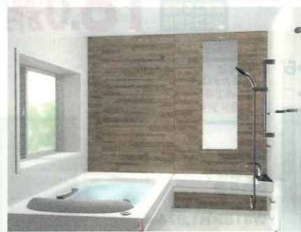
人造大理石「グランザ」