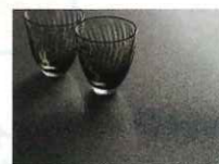
セラミックトップ