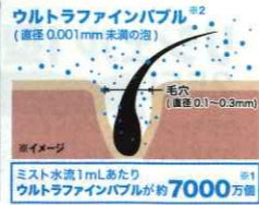
ウルトラファインバブル ※2 (直径0.001mm未満の泡) ミスト水流1mlあたりウルトラファインバブルが約7000個

ウルトラファインバブルを含んだやわらかな肌あたりのミストで、やさしく皮脂汚れを洗い流します。