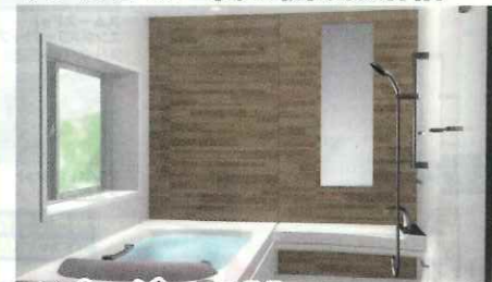
人造大理石「グランザ」