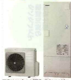
写真はイメージです(画像:日立HPより)

日立 エコキュート BHP-FG37WU 370ℓ/3~5人用フルオートタイプ リモコン、脚カバー付