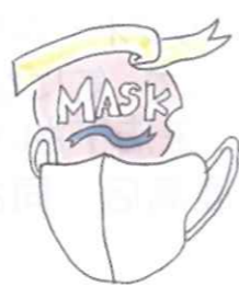
口紅がつきにくいタイプや色つきなど、機能的でおしゃれなマスクも登場