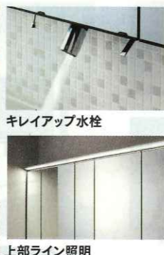
キレイアップ水栓